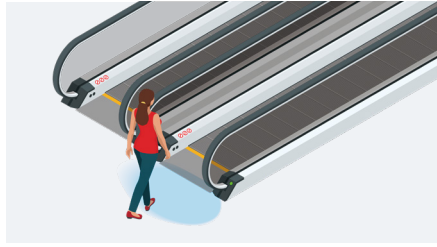
自动人行步道启动